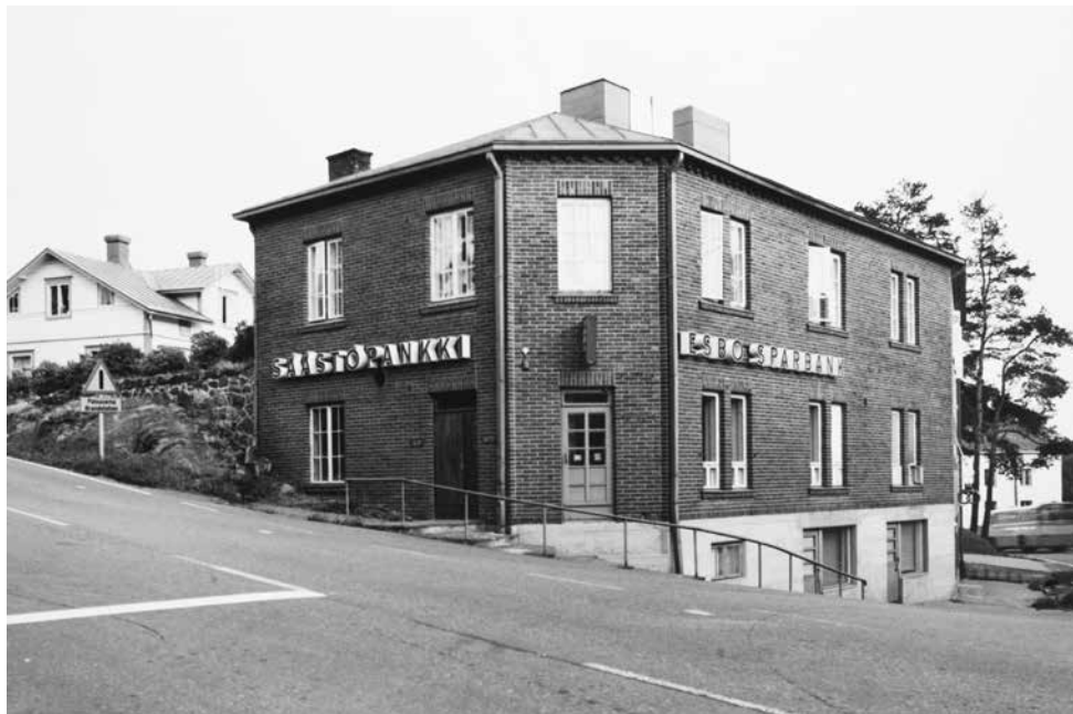
Halmeen talossa Kauklahdessa oli myös Espoon Säästöpankin konttori.