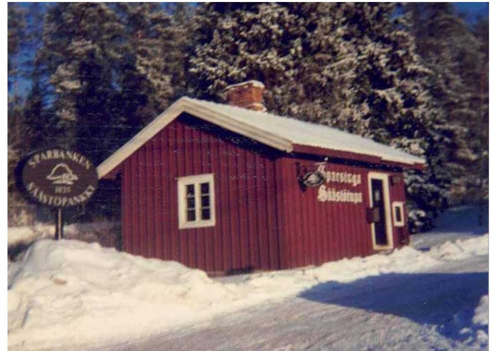
Helsingin Säästöpankin Säästötupa Bembölessä jossa nykyään kampaamo

Bemböle var en livlig trafikmässig knutpunkt på 1960-talet. Ring III byggdes 1964 och i närheten fanns bl.a. kaffes-