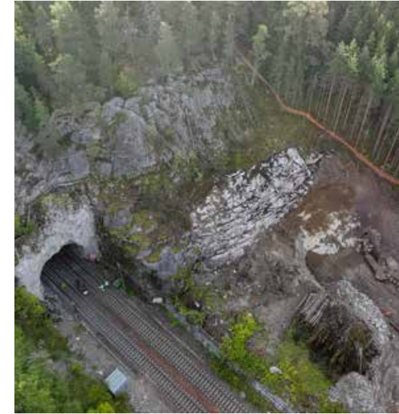
Tunnelityömaa kuvattuna Kauklahten suunnasta.

Tommi Rosenvall, projektipäällikkö, Väylävirasto.